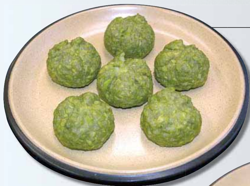
丸茄子（地元産）の鉄砲焼